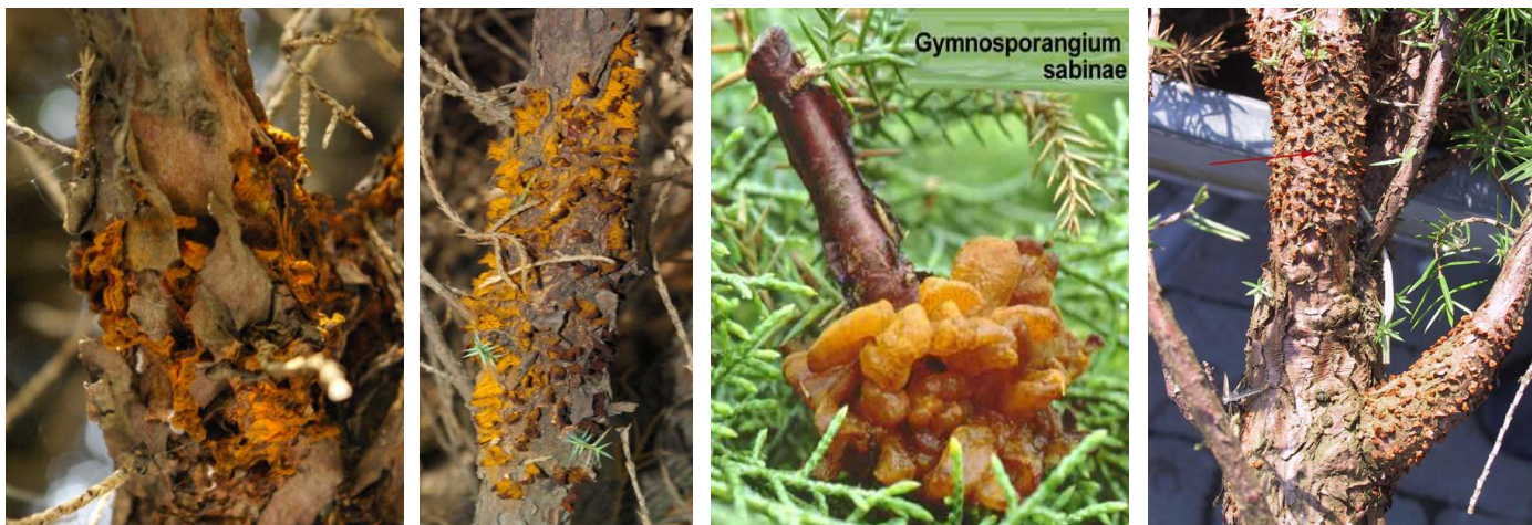
Photos 5, 6 & 7 : Symptômes en mai - juin sur genévrier, Photo 8 : Symptômes en juillet - avril sur genévrier.

Au mois d'avril ou mai, les genévriers atteints présentent des renflements le long des branches contenant de petites verrues brunâtres ( Photos 5 & 6 ). Sous l'action de la pluie, ces petites verrues gonflent, devenant des masses gélatineuses ( Photo 7 ). Lorsqu'elles deviennent brun orangé, elles libèrent les spores qui iront contaminer le poirier. Par après, ces verrues se dessèchent et se désintègrent. Ce rameau gardera des cicatrices sous forme de bourrelets fusiformes, ce qui permettra de le reconnaître durant les années suivantes ( Photo 8 ).