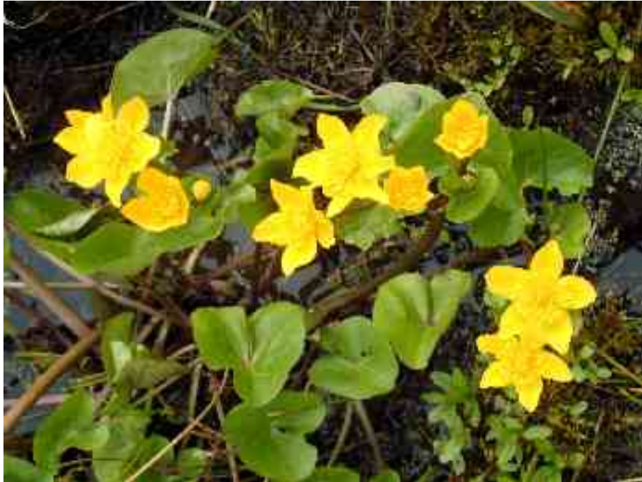
( Caltha Palustris - Famille des renonculacées)