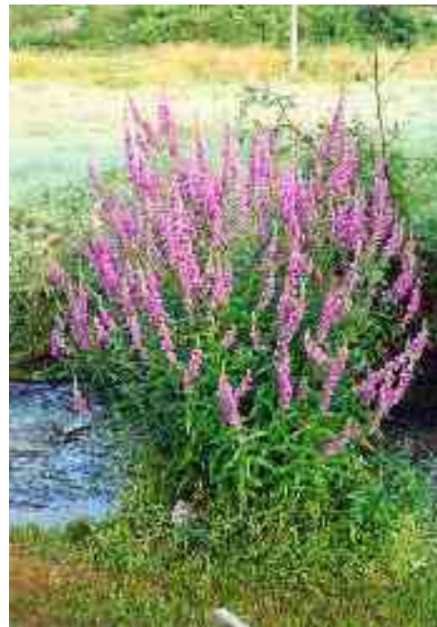
La lysimaque et la salicaire, deux plantes des bords des eaux indigènes