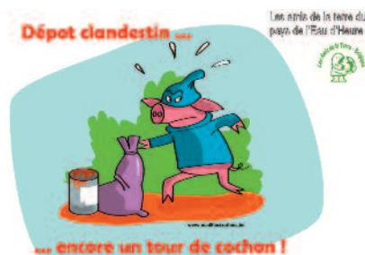
Pancarte réalisée pour mettre en évidence les dépôts illicites

Tél. 071/64 41 82 ou jeanphilippe.body@skynet.be