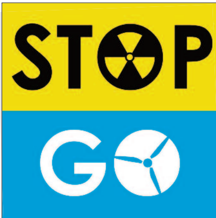
Logo de la plateforme « Stop & Go »

Alors que le rythme paisible de l'été nous berce, un moment clé pour la sortie du nucléaire s'annonce.