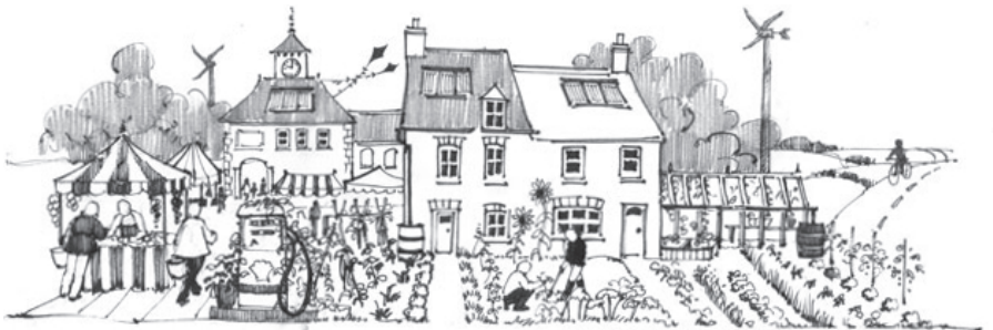
Une partie de l'illustration de la Transition, reprise sur le « manuel de Transition »