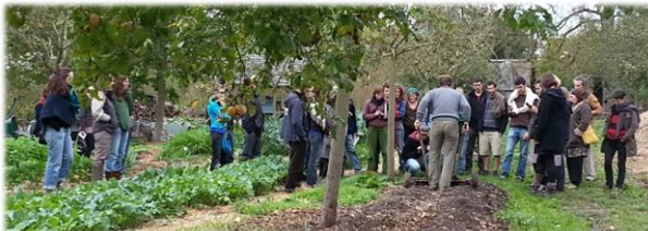
Une visite au Bec Hellouin en Normandie

Comme exercice pratique de « permaculture humaine », une grande rencontre avec les acteurs du secteur est organisée pendant une des journées du stage. Elle permet aux participants de s'exercer « en temps réel » aux méthodes d'intelligence collective et de rencontrer des personnes avec lesquelles ils pourront collaborer dans le futur.