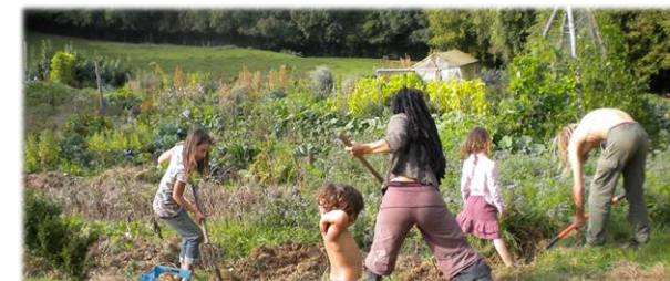
En famille sur le terrain

Pourquoi ne pas constituer une petite association qui pourra proposer un bail emphytéotique, une location ou tout autre accord avec une commune, un CPAS, une administration ou le propriétaire d'une terre en friche et pourra générer peu à peu une récolte et des contacts locaux ?