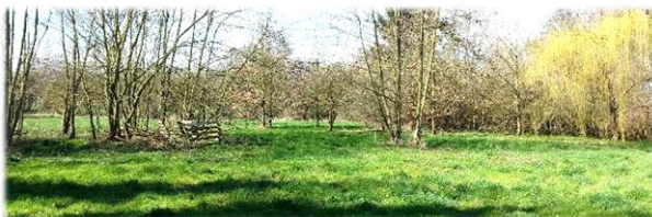
Une vue du jardin à Forville

Formation reconnue par le Ministère Wallon de l'Agriculture et le Mouvement International de Permaculture