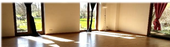
Une vue de la salle de 90 m 2 donnant sur le jardin

RÉGÉNÉRER LES PAYSAGES NATURELS ET HUMAINS TOUT EN ASSURANT LOCALEMENT NOS BESOINS ESSENTIELS